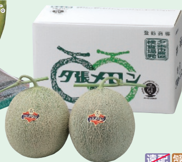
※写真は良品2玉です。

〈北海道〉JA夕張市 夕張メロン 良品 1.3kg 2玉 2玉(約1.3kg×2) [箱]15×34×20cm ※のしは箱の中に入っています。