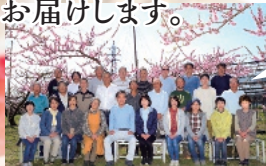
加納岩果実農協生産者のみなさん

全国の桃の筆頭産地である山梨県の中でも笛吹川沿いの加納岩の自然と風土、土づくりにこだわり、ひとつひとつ丹精を込めてつくったまるかの果実をぜひご賞味ください。