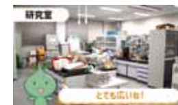
オンラインで見学