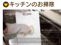
キッチンのお掃除