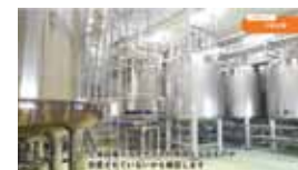
安全・安心のヒミツ

コープ北陸の安全確認のとりくみ紹介や食中毒予防などに役立つ動画を公開中!ぜひご覧ください。